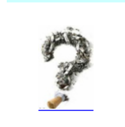
اختلالات وابسته به مواد