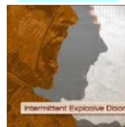
اختلالات کنترل تکانه